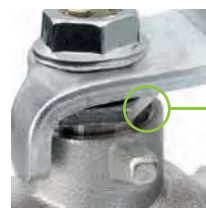
Premistoppa Stuffing box Presse-étoupe